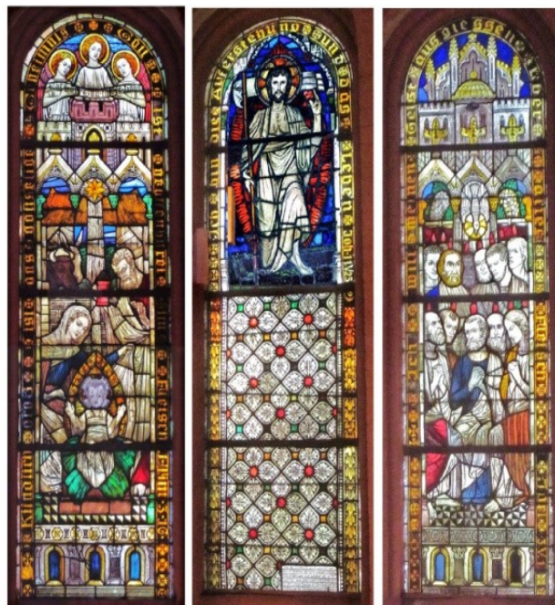
Altarbild in der Michaeliskirche Hannover-Ricklingen

Der Freundeskreis setzt sich zum Ziel, neben diesen Aktivitäten auch die regelmäßig stattfindenden Veranstaltungsreihen „Musikalischer Gottesdienst“ und „Orgel Plus“ finanziell abzusichern und strukturell zu fördern, Gastensembles zu engagieren oder projektbezogene Konzertveranstaltungen – wie die Auf-führung von Oratorien, Musicals geistlichen Inhaltes – möglich zu machen.